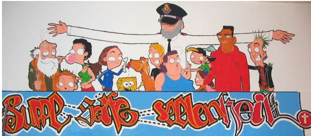
Dieses Bild hing längere Zeit in unserem Speisesaal. Es zeigt die Vielfalt unserer Gäste und den Slogan “Suppe, Seife, Seelenheil.“

JESUS ist dieser SIEGER . Dies dürfen wir selber in unserem Leben erfahren und wir wünschen uns, dass dies auch unsere Gäste erleben.