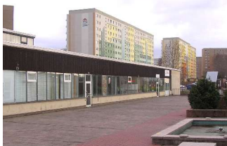
Im Vordergrund: unsere Räume

Viele Menschen im Heckert sind heute desillusioniert. Ihre Beziehungen und wirtschaftlichen