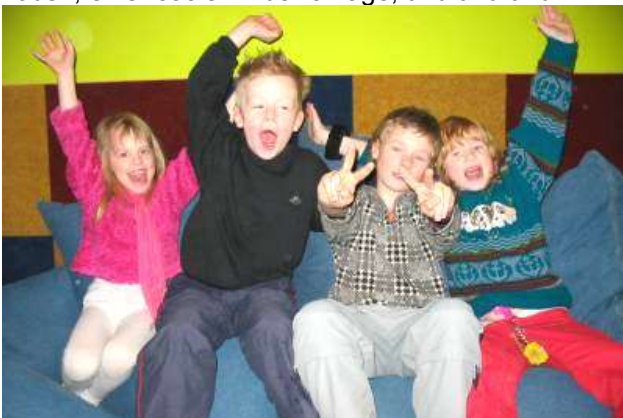
Die Kinder sind begeistert vom neuen KINDERRAUM.

Und nun ist es endlich soweit: Die Kinder haben ihren eigenen Raum. Toll ausgestattet mit fetzigen Spielen, einer megastarken Kletterwand, Platz zum Toben, einer coolen Musikanlage, und und und.